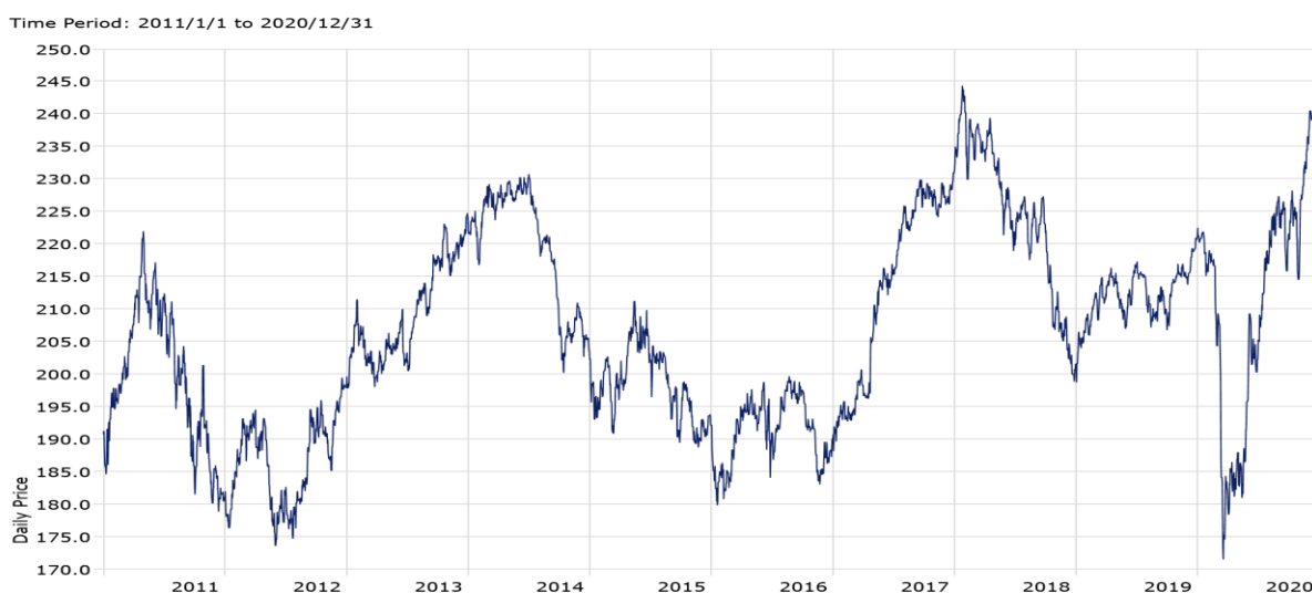
— AXAWF Optimal Income A Cap EUR pf