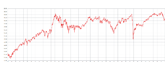
A 股歐元 (歐元)

資料來源：Lipper, 截至 2022/3/31。 此級別的成立日 - 1994 年 10 月 17 日