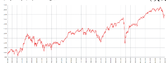
A 股累計美元避險 (美元)

資料來源：Lipper, 自基金成立以來迄 2022/3/31。 此級別的成立日 - 2014 年 4 月 9 日